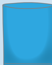
65cm × 80cm