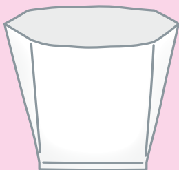
35cm × 50cm マチ付